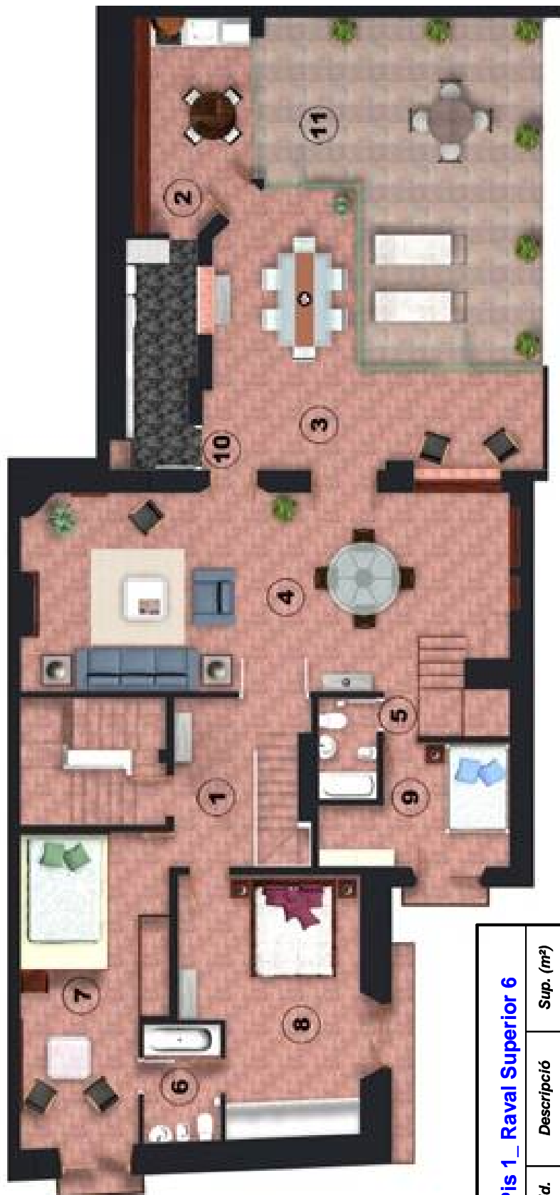
Pis 1_ Raval Superior 6